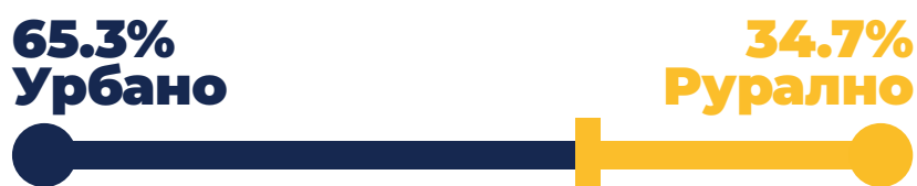
График 2. Структура узорка према карактеристикама средине у којој

Више од једне половине испитаника истиче да живи у урбаној средини (65,3%), док 34,7% испитаника живи у руралној средини.