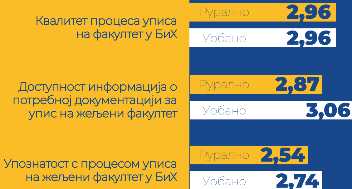
График 3. Просјечне оцјене упућености с процесом уписа на факултет, доступности информација о потребној документацији за упис и квалитете процеса уписа на факултет у БиХ према

Додатним анализама је утврђено да испитаници, који живе у урбаној средини, су значајно више упознати с процесом уписа на жељени факултет у односу на испитанике који живе у руралној средини. Такође, у поређењу са испитаницима који живе у руралној средини, испитаници који живе у урбаној средини сматрају да су им информације о потребној документацији за упис на жељени факултет доступније. У коначници, није утврђена статистички значајна разлика између поменутих група испитаника када је у питању проћена квалитете процеса уписа на факултет у БиХ.