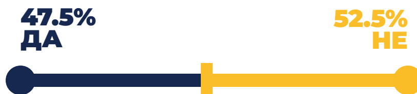
График 6. Упознатост с иницијативном „И копија вриједи“

Кроз анкетно испитивање сазнајемо да чак 52,5% испитаних ученика није упознато са самом Иницијативом, односно могућношћу уписа са овјереном копијом.